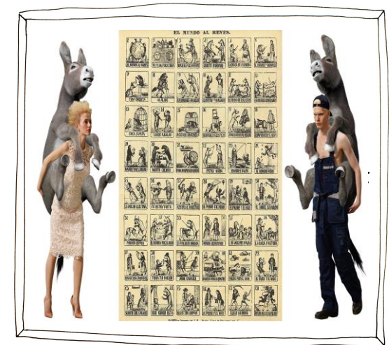
Afb. 1 - AES+F, Inverso Mundus , 2015

De opdracht 'Remake – de wereld op zijn kop' gaat over het spelen met macht en de bewustwording ervan. Ze laat leerlingen nadenken over hoe machtsverhoudingen in elkaar zitten en waar ze zich allemaal kunnen bevinden. Het vervolgens omgooien van die verhoudingen geeft vrijheid en beleving voor leerlingen, nu hebben ze de kans om die verhoudingen naar hun eigen hand te zetten! Hierbij inspireren we de leerlingen met voorbeelden van actuele kunstenaars (zie afb. 1 en lees voor een verdere uitleg het stukje over authentieke kunsteducatie). Zo krijgt de creatieve uitwerking van hun concept voor hen meer betekenis, omdat ze direct zien dat dit een onderwerp is waar kunstenaars serieus mee bezig zijn.